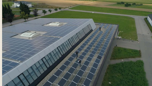
Werk 1 : die Bürger Energie Deißlingen eG prüft die Photovoltaik-Installation auf der Volksbanksporthalle.

Wie kann Nachhaltigkeit in einer ländlichen Gemeinde umgesetzt werden? Funktioniert das? Hervorragend, wie dieser Landleben 4.0 Film zeigt: rund um Denklingen, zwischen Neckartal und Albhochfläche gibt es ehrgeizige Ziele. Hier haben sich fünf Gemeinden - Denklingen, Aldingen, Frittlingen, Deißlingen und Wellendingen - kreisüberschreitend zu einem Nachhaltigkeitsverbund, der « N !-Region FÜNF G » zusammen geschlossen.