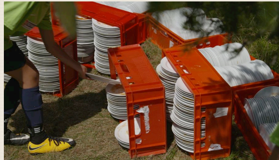
Fußballzeltlager auf dem Klippeneck, seit 1967 vom FSV Denklingen organisiert und seit über 30 Jahren vorbildlich nachhaltig. Kein Wegwerfgeschirr – es wird gespült !